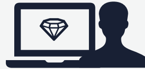
Bartke & Husetic Hiring Experts